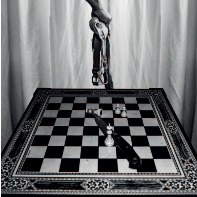
Violència de gènere