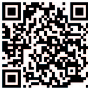
QR Audiovisual COVID-19