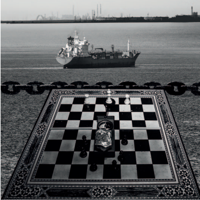
Explotació del Nord al Sud