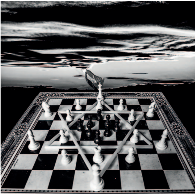
Genocidi del poble palestí a Gaza