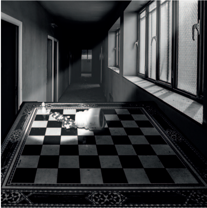
Soledat. Depressió. Suïcidi.