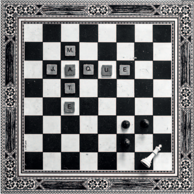
Barreres i discapacitat