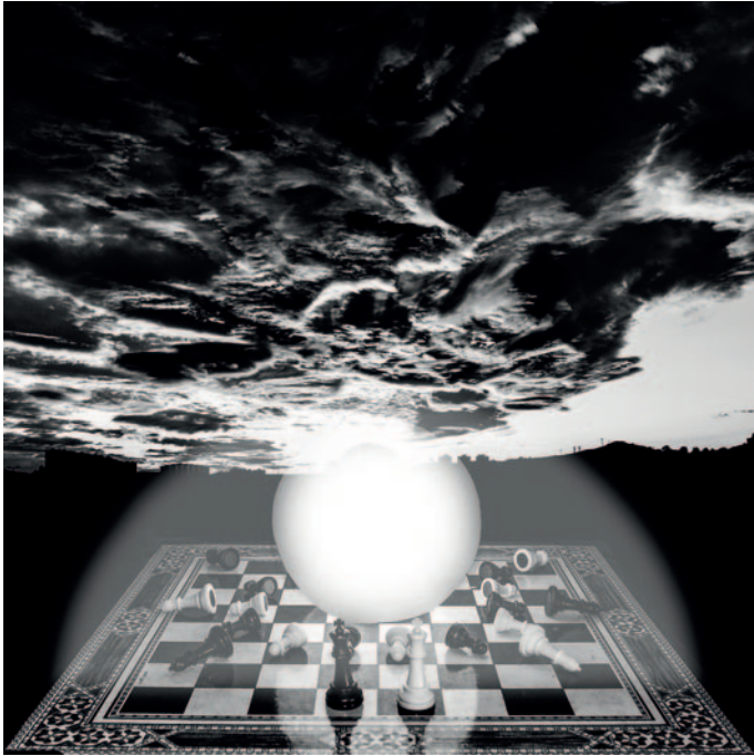
Guerra o desastre nuclear