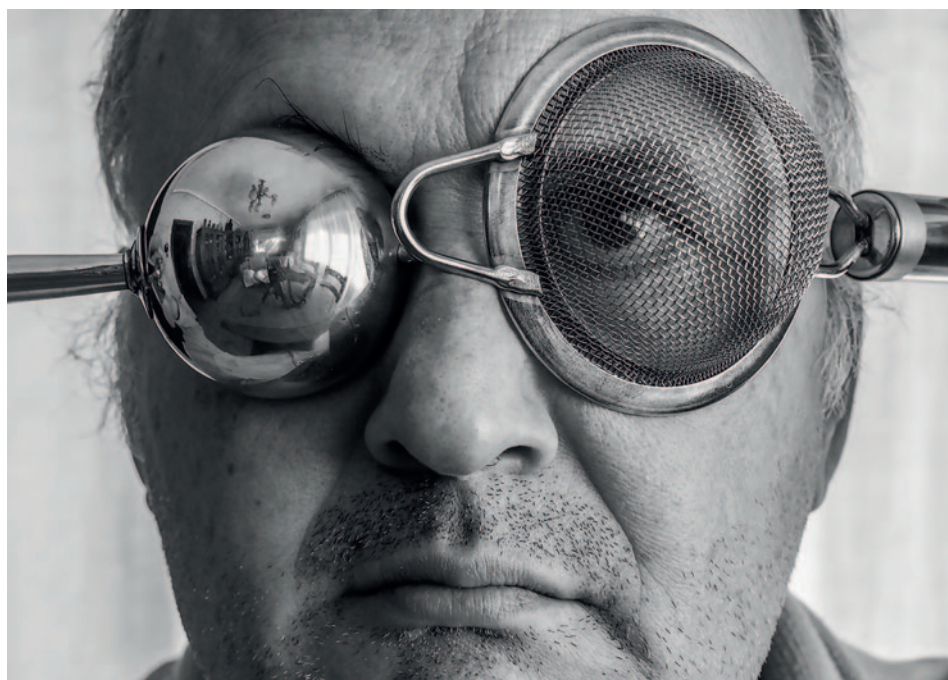
Visió oculta & Visió filtrada