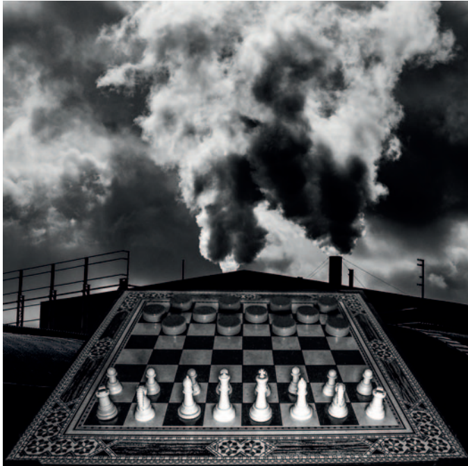
Contaminació i canvi climàtic